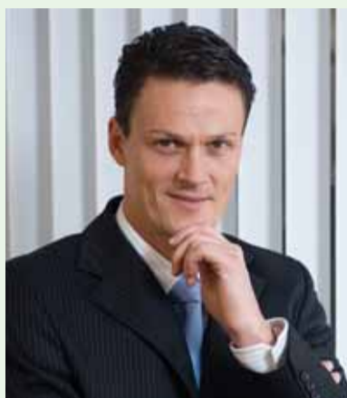
ПРЕЗИДЕНТ BMW GROUP RUSSIA КРИСТИАН КРЕМЕР

«В этом году нашим клиентам в России также будут представлены новые модели BMW 3 серии купе и кабриолет, BMW X5, BMW ActiveHybrid X6 и BMW ActiveHybrid 7, также в конце года нами запланирована премьера новой модели, которая в лице своего предшественника завоевала сердца многих автолюбителей», - подчеркнул Кристиан Кремер.